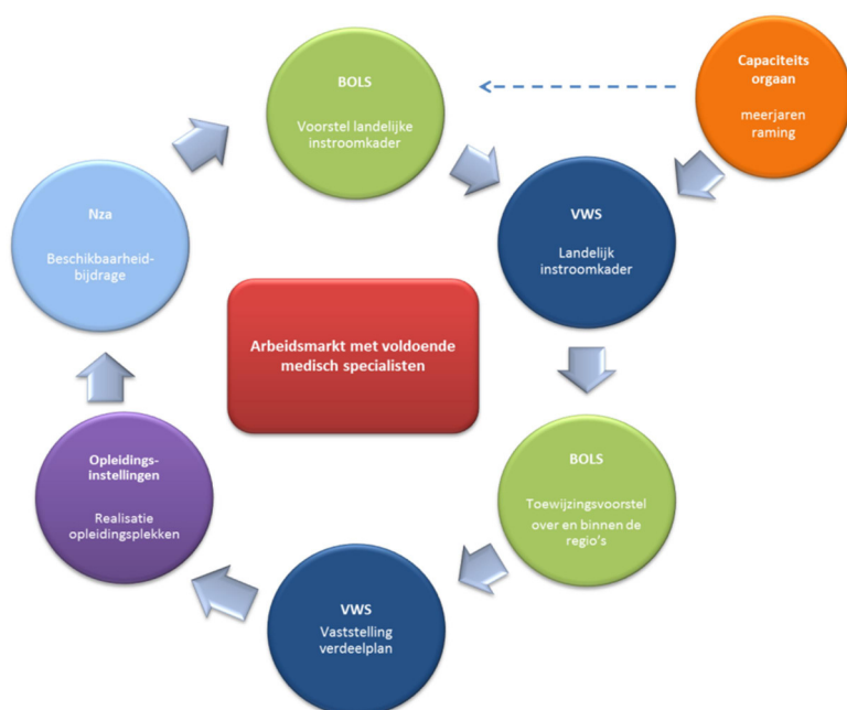
Figuur 1. Cyclus toewijzing opleidingsplaatsen medische vervolgopleidingen

Voor vragen of verdere toelichting is BOLS bereikbaar via info@stichtingbols.nl of 030-2739265.