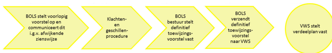
Figuur 5: Vaststellen van het definitief toewijzingsvoorstel voor alle medisch specialismen

De klacht of het geschil dient schriftelijk en gemotiveerd te worden ingediend of aanhangig gemaakt bij de commissie. Vervolgens zal de commissie de partijen, die een klacht hebben ingediend of een geschil aanhangig hebben gemaakt, horen en op diezelfde dag uitspraak doen.