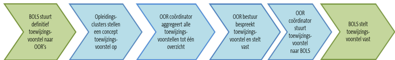
Figuur 4: Het opstellen van het concept toewijzingsvoorstel binnen de OOR's

Op basis van het door BOLS definitief vastgestelde toewijzingsvoorstel over de OOR's stellen de OOR's voor alle (Medische) Vervolgopleidingen een voorstel op voor de toewijzing over de opleidingsinstellingen binnen een OOR. Schematisch kan dit proces als volgt worden weergegeven: