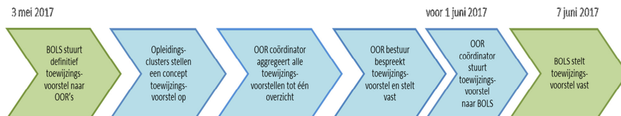
Figuur 3: Het opstellen van het concept toewijzingsvoorstel binnen de OOR's

Op basis van het door het BOLS-bestuur definitief vastgestelde toewijzingsvoorstel over de OOR's stellen de OOR's voor alle (Medische) Vervolgopleidingen een voorstel op voor de toewijzing over de instellingen. Schematisch kan dit proces als volgt worden weergegeven.