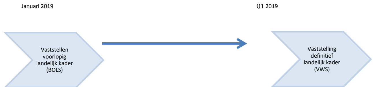
Figuur 2: Opstellen van het landelijk instroomkader

BOLS stelt een landelijk instroomkader per specialisme vast, naast een procentuele verdeling van instroomplaatsen per OOR. Uitgangspunt hierbij is Toewijzing 2019 = Toewijzing 2020. Samen met de input van BOLS bepaalt de minister van VWS in een later stadium de definitieve maximale instroom per specialisme die voor een beschikbaarheid bijdrage in aanmerking komt.