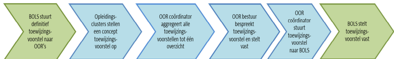
Figuur 4: Het opstellen van het concept toewijzingsvoorstel binnen de OOR's

Op basis van het door BOLS definitief vastgestelde toewijzingsvoorstel over de OOR's stellen de OOR's voor alle (Medische) Vervolgopleidingen een voorstel op voor de toewijzing over de opleidingsinstellingen binnen een OOR. Schematisch kan dit proces als volgt worden weergegeven: