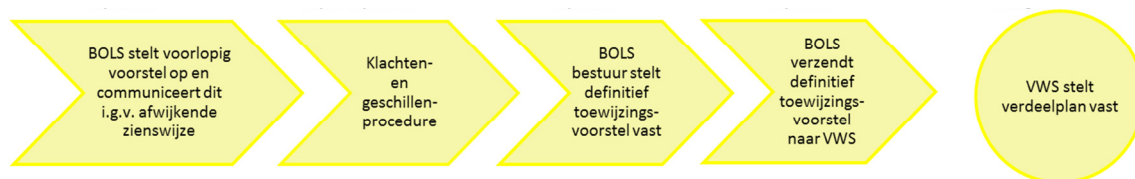
Figuur 5: Vaststellen van het definitief toewijzingsvoorstel voor alle medisch specialismen

De klacht of het geschil dient schriftelijk en gemotiveerd te worden ingediend of aanhangig gemaakt bij de commissie. Vervolgens zal de commissie de partijen, die een klacht hebben ingediend of een geschil aanhangig hebben gemaakt, horen en op diezelfde dag uitspraak doen.